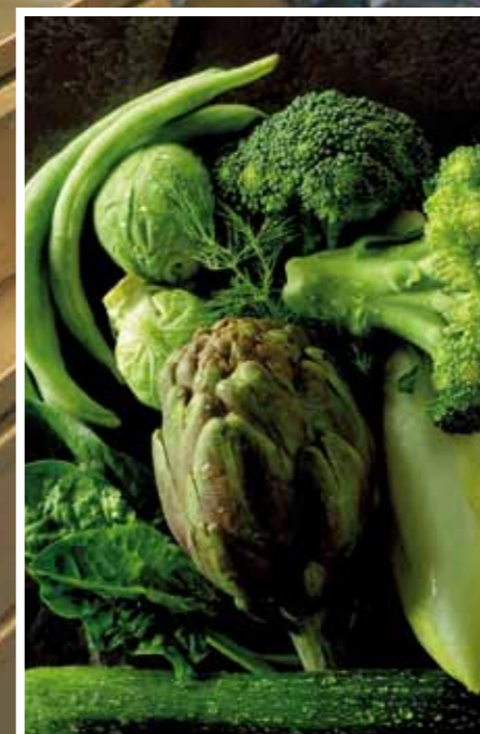
Озон не просто уничтожает вредные микроорганизмы, но и препятствует их дальнейшему росту.