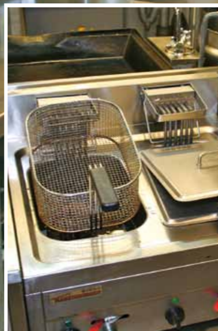
Запахи и жир причиняют вред как вентиляционной системе, так и всем, кто находится в этом же здании.