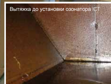
Вытяжка до установки озонатора ICT